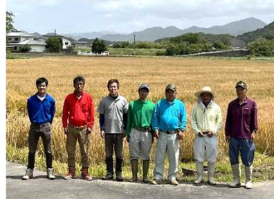
(有)ファーム寒川の皆さん