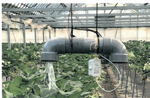
通風筒と温度データロガー

管内ではSFSが3戸・5台導入されている。しかしながら、導入コストが非常に高いうえ世界情勢により部品供給が不安定であり、現時点ではこれ以上の導入は期待できない。そこで、6ほ場の協力を得て、温度データロガーとスマートフォン上のアプリを活用し、ほ場主がアプリを立ち上げると、記録されたデータがクラウドに保存される低コストでハウス内温度をモニタリング・情報共有できる環境を整備し、部会内でそのデータを共有できるようにした。