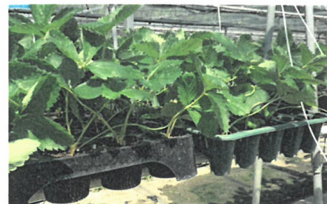
左：空中ポットレストレー

育苗資材は従来、「すくすくトレイ」であるが、気化潜熱による昇温抑制効果が期待される「空中ポットレストレー」を導入した生産者の収量増加事例を基に、同資材の効果を調査し、得られたデータを講習会で紹介し普及を図った。