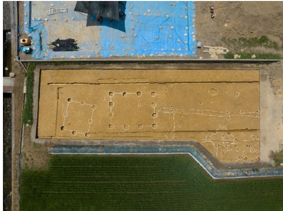
岡遠田南遺跡で見つかった飛鳥時代の建物跡

発掘調査成果について、専門職員がわかりやすく解説する現地説明会を開催しますので、ぜひご参加ください。