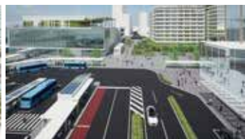
「高松中心市街地プロムナード化検討会議」 （検討用イメージ資料）