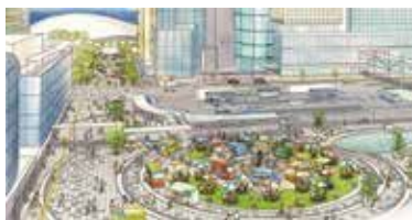
「サポートFACTプロジェクト」 （官民連携によるにぎわいと活力ある まちづくりイメージ資料）