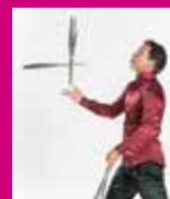
ジャグリング Juggler Laby