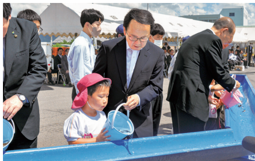
観音寺こども園園児と稚魚の放流

昨年香川に戻ってきて感じたことのひとつが、街中での潮の香りが減ったことです。私は栗林公園のそばで生まれ育ちましたが、そのあたりまで潮の香りが漂っていました。下水道の普及で海が