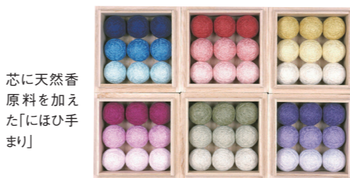
芯に天然香原料を加えた「にほひ手まり」