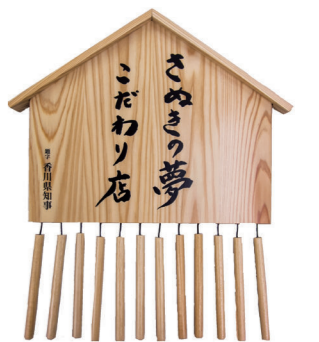
問い合わせ先 農業生産流通課 ☎087-832-3417