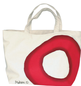
現代アートの美術作品から生まれたデザイン