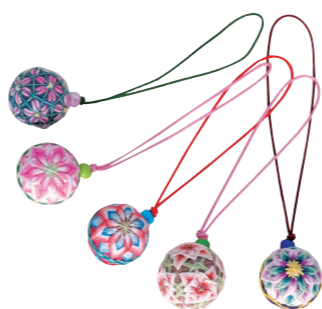
熟練の技で小さくつくられたストラップ