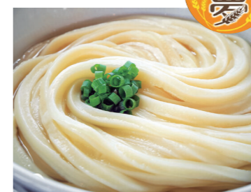
※写真はイメージです

現在栽培されている「さぬきの夢2009」の後継となる、よりコシの強い新品種が誕生します。2025年からの切り替えを前に、新品種100%で作ったうどんを無料・先着順で1日1000食提供。新品種をいち早く味わうチャンスです！