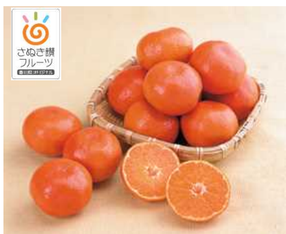
さぬき讚フルーツ 「小原紅早生」