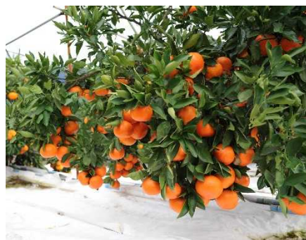
収穫時期を迎えた 「小原紅早生」