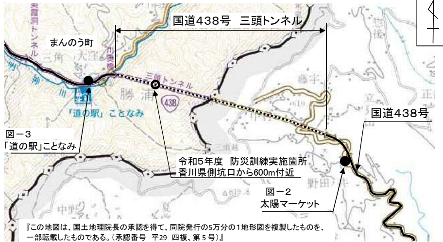
(図一) 令和5年度 三頭トンネル防災訓練 位置図