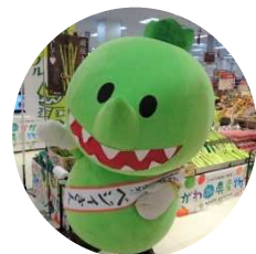
香川県産野菜イメージキャラクター ベジィさん