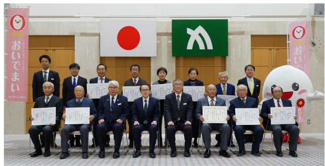
第7回「おいでまい」品質・食味コンクール表彰式 令和5年2月22日