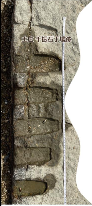
土庄 千振石丁場跡