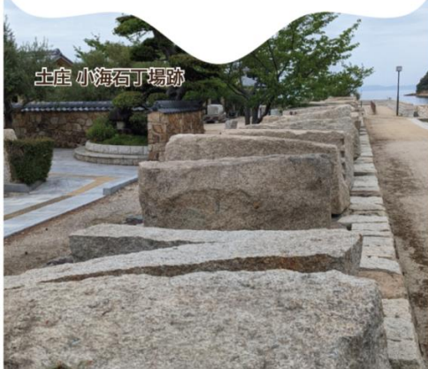
土庄 小海石丁場跡