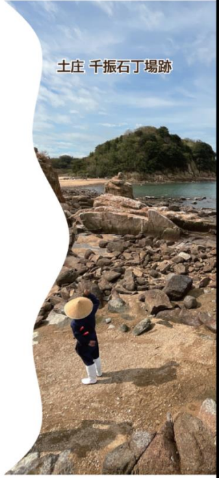
土庄 千振石丁場跡