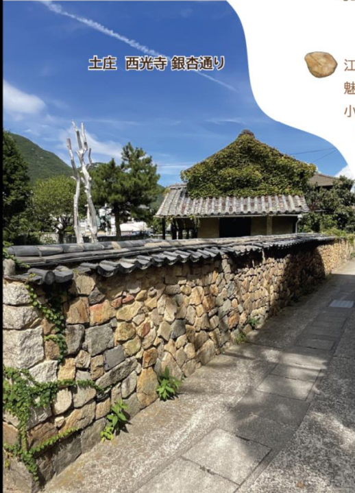
土庄 西光寺 銀杏通り

江戸時代の大坂城築城に関わる石丁場跡をはじめ、小豆島には多くの魅力的な石に関連する文化遺産が存在します。このシンポジウムでは、小豆島ならではの魅力をどのように発信し、活かしていくかについて考えます。魅力の中身を学び、技術の再現を通じて、文化財を身近に感じる取組についても議論します。