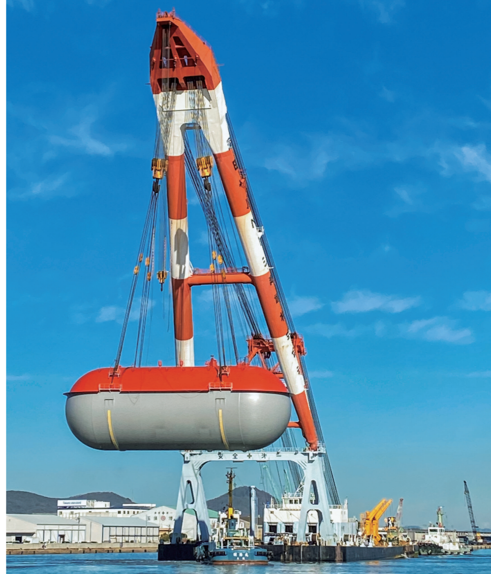
常温加圧式タンクとして世界最大の容量6,500m 3 を製造

準はとても高い。私たちは設計の段階からお客さまと打ち合わせを重ね、長年培った経験と知識、高い加工技術でその声に応えます」と富家さん。 鋼材問屋の子会社として創業し、鋼材の保管と簡単な加工からスタートした同社。「父の代から本格的にタンク製造を手掛けるようになりました。よく『うちは日本で2位のタンクメーカーだ』と聞かされたのですが、実のところ当時は日本に2社しかなかったんです。そこから現在の世界トップシェアの地位を確立できたのは、お客さまと密にコミュニケーションを取り、困りごとやご要望にきまこまかく対応したことで、信頼関係を築けたからだと思っています」。