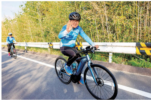
電動スポーツサイクルの試走イベントにて

乗車中の事故が多いことです。昨年の県内交通事故死者数33人のうち、自転車乗車中の方は8人と全体の24%でした。この数を減らしていくためには、自転車のシートベルトというべき「ヘルメット着用」が重要であると思います。自転車のヘルメット着用は昨年「努力義務化」となりましたが、県内の着用率は約7.1%にとどまっています。