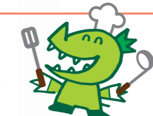
香川県産野菜イメージキャラクター「ベジィさん」