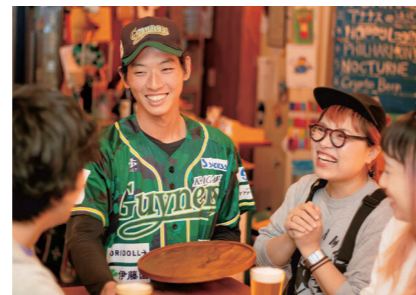
中吊広告に使う写真の一例