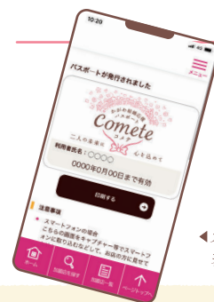
◀スマホ画面表示イメージ

香川県で結ばれた二人に祝福を込めて。この街のゆたかな発展への願いを込めて。地域全体で心を込めて、二人の未来を応援したい。そんな想いを、かがわ結婚応援パスポート「comete(コメテ)」に込めました。ぜひご協賛いただきますようお願いいたします。