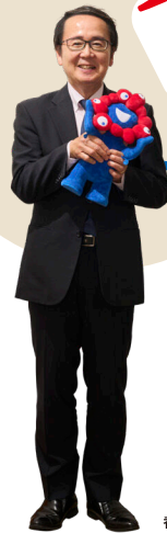
香川県知事 / 池田 豊人