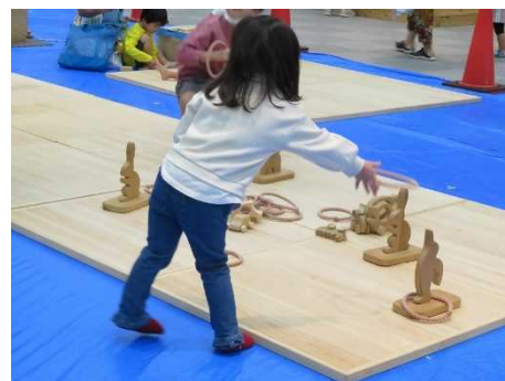
▲木育広場の開設状況