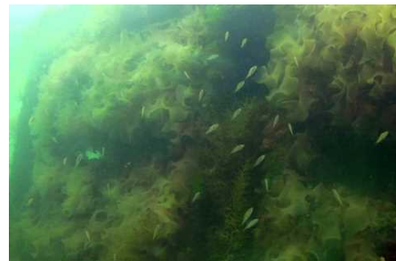
▲ 藻礁に繁茂する海藻とメバルの稚魚

水産基盤整備事業により、県内の浅海域の適地にコンクリート製ブロックを設置するなど、多くの魚介類の重要な産卵場、幼稚魚の育成場となっているガラモ場を造成しました。