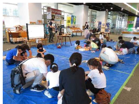
▲かがわの森アンテナショップ （木工工作イベント）