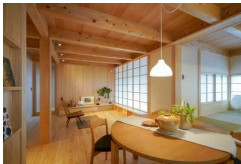
▲県産ヒノキを利用した住宅