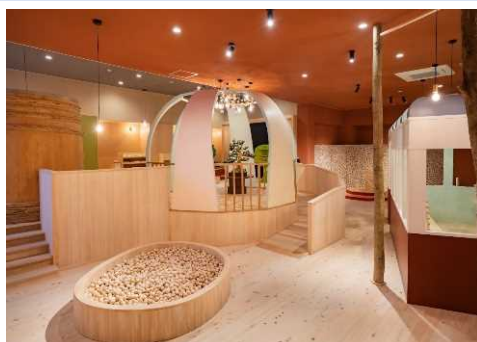
▲県産木材を利用した民間施設