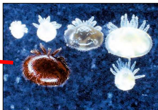
ミツバチヘギイタダニ