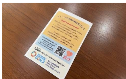
センター紹介チラシ