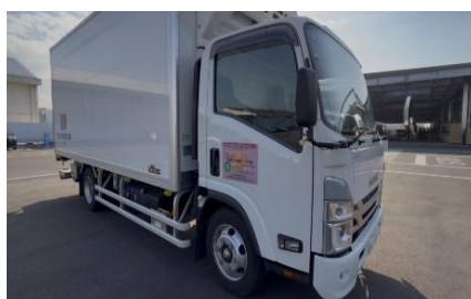
社用車を活用した広報啓発活動状況