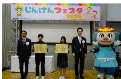
「大切な命を守る」全国中学・高校生 作文コンクール香川県大会