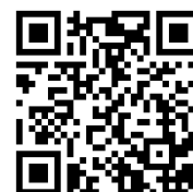
社用車を活用した広報啓発