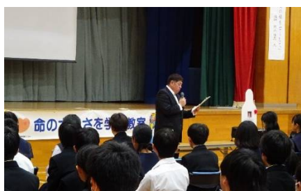
「命の大切さを学ぶ教室」開催状況