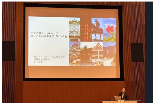
<香川県女性デジタル人材育成事業>