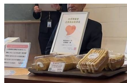
寄附金付き被害者支援商品