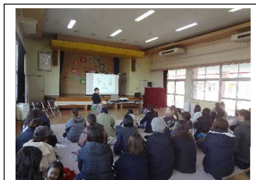
<さぬきっ子安全安心ネット指導員養成講座> <さぬきっ子安全安心ネット指導員による学習会>