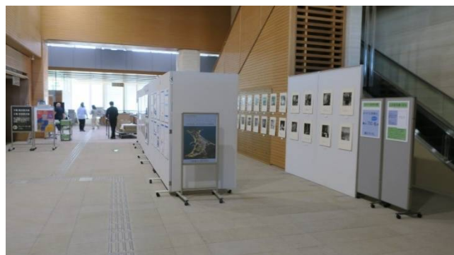
大島青松園入所者作品・パネル展