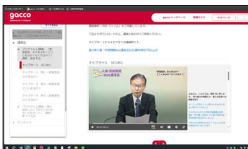
<人権・同和問題 Web 講演会>