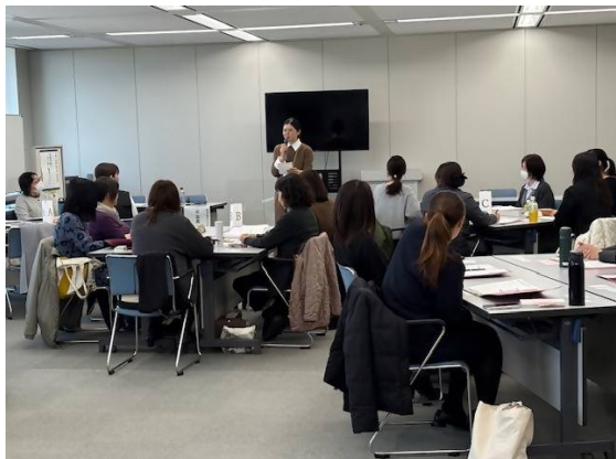
<香川県女性が輝くリーダー養成セミナー>