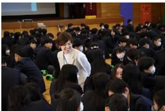
〈情報モラル・セキュリティ学習〉