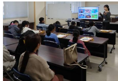
〈ポスターセッション〉