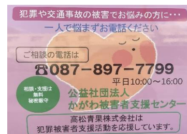
広報用ステッカー (社用車貼付)