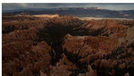
ブライス・キャニオン国立公園