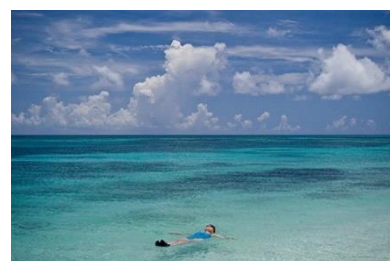
ドライ・トートウガス国立公園