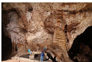
カールズバッド洞窟群国立公園