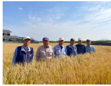
(農) 六郷のメンバー