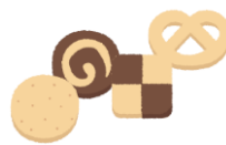
どら焼き、クッキー、 ケーキなど和洋菓子