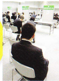
個人の特性に応じた就職と一緒に考え探します