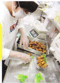
関係機関と連携して行います