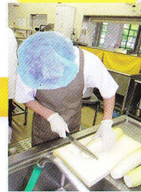
厨房スタッフが指導を行います

施設内の厨房で、調理補助、野菜の下ごしらえ、食器洗浄配膳などの調理補助業務を行い、仕事の模擬体験を経験します