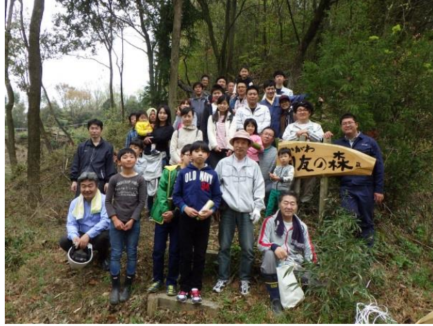
<参加者の皆様で記念撮影>

今回は、アオダモやコナラ、ヤマザクラなど 6 種 110 本の苗木を植林しました。