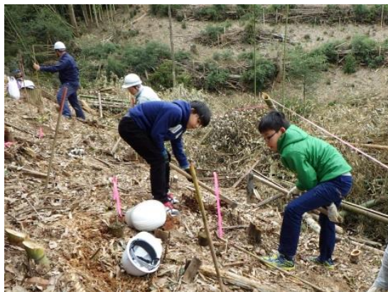
<教わったとおり作業していきます>