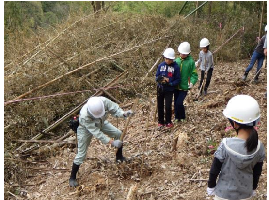
<次に植林作業の方法を学びました>