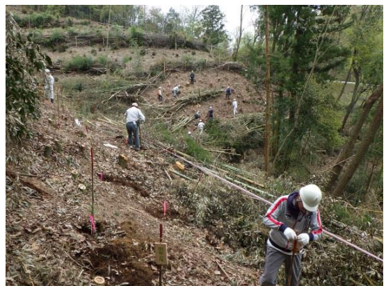
<みんなで協力して植林を行いました>

参加者は 3 つのグループに分かれ、県や塩江町森林組合職員の指導を受けながら、森づくり作業に取り組みました。