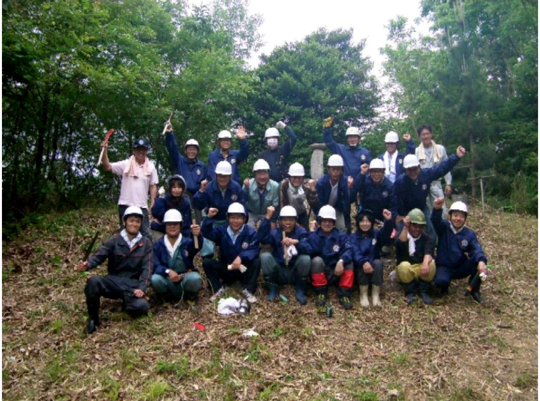
<参加者の皆様で記念撮影>

これは、平成25年5月9日に、高松空港ライオンズクラブ、高松市、県が協定を結んだ「フォレストマッチング協働の森づくり」協定に基づく活動です。