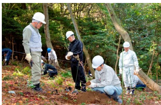
< 苗木を1本1本丁寧に植える参加者 >