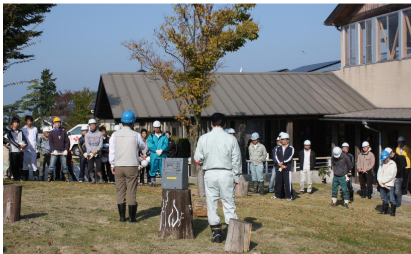
< 坂出市五色台ビジターセンターで事業説明を受ける参加者 >

秋晴れのもと、参加者は、かがわフォレスターや県職員（林業職）から植え方の指導を受けながら、「モミジ」の苗木200本の植林を行いました。