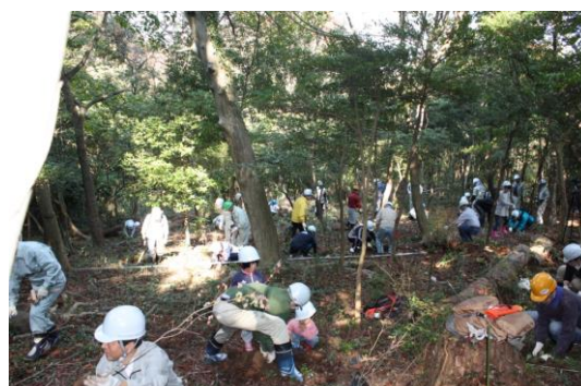
< 区域内に広がって植林する参加者 >

植えたあと、参加者は、苗木の横に「美しい森になってね!」「大きくなあれ!」などそれぞれの思い込めたメッセージの杭を立てました。