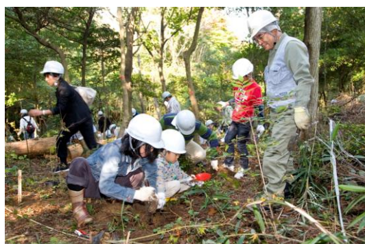
< 子供たちも一緒に植林 >