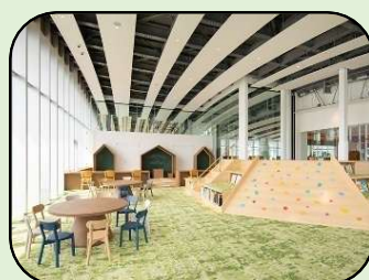
丸亀市：市民交流活動センターマルタス