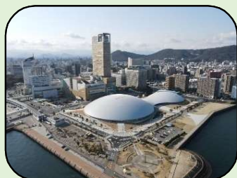
高松市：穴吹アリーナ