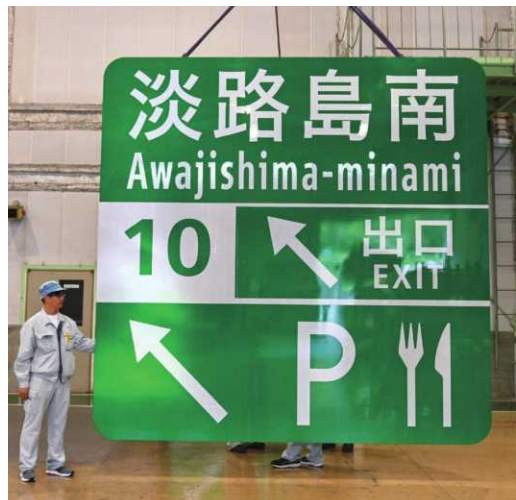
(上) 同社が手掛けた標識の例 (下) 完成した標識