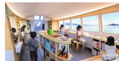
▲こども図書館船「ほんのもり号」

知事 香川の島は本土から近いので、住まなくても関係人口を増やし、交流を促進できると考えています。今後もボランティア活動を推進し、また、定期船以外にも、例えばこども図書館船「ほんのもり号」のような船で、島の人々や子どもたちの交流を広げていけたらと思っています。