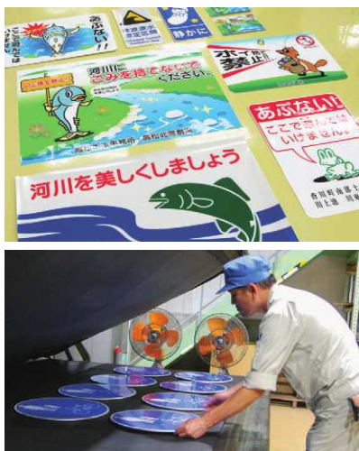
(上) 標識以外の掲示物は自社でデザインも提案 (下) 貼り付けたシートを定着させる工程