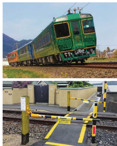
(上) 同社がラッピングを手掛けた観光列車「四国まんなか千年ものがたり」の車両 (下) 鉄道用簡易遮断機