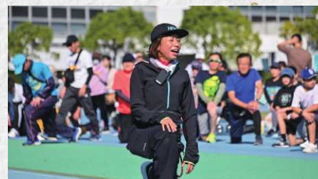
かがわマラソン2026の関連行事「梅の里あやがわジョギング教室2025」では、走る時の姿勢などをアドバイス