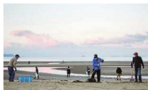
▲ちちぶの会清掃活動の様子

知事 ちちぶの会の長年にわたる継続的な活動のおかげで父母ヶ浜が世界的にも注目される場所となりました。若い世代や移住者が参加しやすいよう、誰でも気軽に参加できる仕組みづくりが大切だと思います。ぜひこれからも活動を続けていただきたいと思います。