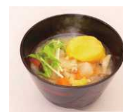
▲さだまさし作詞・作曲の「城のある町」から着想を得た料理。月を模した丸い食材と菜の物がポイント。

「月菜汁」という架空の郷土料理を本物の郷土料理として広める活動をしています。郷土料理や家族と過ごす温かい思い出が、県外に出た時の心の支えになると考え、地域でそうした思い出づくりのきっかけを作りたいと思っています。