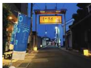
▲志度エリア源内通り

2025年8月に志度・津田エリアではじめて開催された瀬戸芸では、さぬき市の各団体が協力し、私たち自治会でもランタンや花のプランターの設置、作品づくりなどに取り組みました。瀬戸芸はさぬき市を大いに盛り上げ、経済効果もありました。今回の瀬戸芸の効果や成果を今後どのように県政に生かしていくのでしょうか。