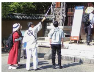
▲おへんろつかさの会のボランティアガイドの様子

さぬき市は四国八十八カ所霊場の「上がり三か寺」があり、遍路への関心が非常に高い町です。前山の「おへんろ交流サロン」では遍路に関する資料の展示や研究を進めています。また、「おへんろつかさの会」の会員もボランティアで遍路に関する文化活動を行っています。四国遍路の世界遺産登録に向けて、今後も香川県として支援をお願いします。