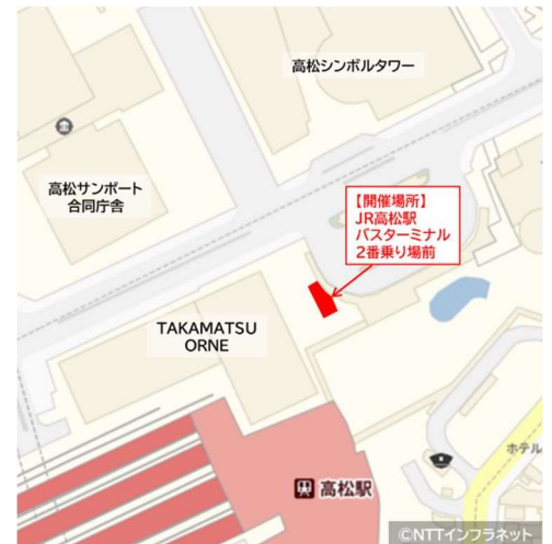
【開催場所の位置図】