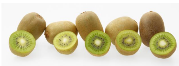
【さぬきキウイっこ®(香川UPーキ1～5号)】