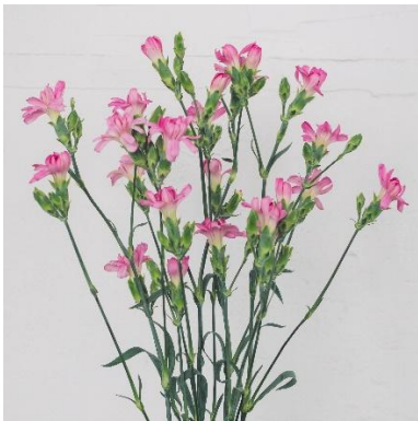
写真3 カーネーション・「ミニティアラライラック」

※飾花やピクトリーブーケには、中讃地域の生産者が栽培したラナンキュラスやカーネーションが使用されます。