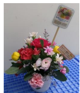
写真1 飾花制作事例

制作した作品は、2月1日(日)に開催予定の「第78回香川丸亀国際ハーフマラソン大会」において、競技場内の来賓席や控え室などに飾花します(写真1)。