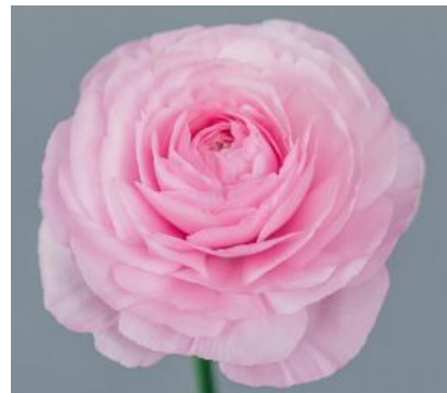
写真4 ラナンキュラス・「恋てまり」