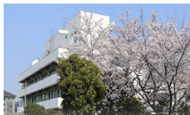
香川県立丸亀病院 Kagawa Prefectural Marugame Hospital