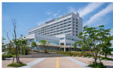
香川県立中央病院 Kagawa Prefectural Central Hospital