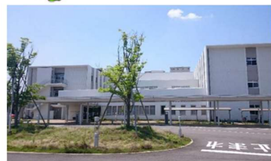
香川県立白鳥病院 Kagawa Prefectural Shirotori Hospital