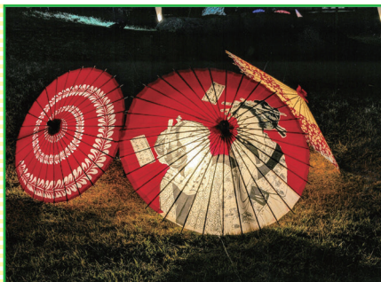
高校生フォトコンテスト佳作