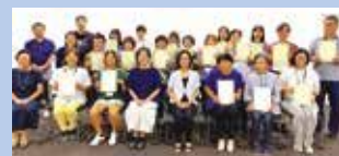
無事に修了された18名のみなさん

文部科学省 令和7年度 地域日本語教育の総合的な体制づくり 推進事業活用・香川県委託事業