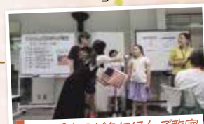
アイパルこどもにほんご教室