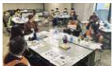
災害時における多言語情報伝達訓練