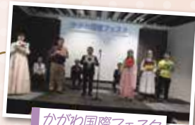
かがわ国際フェスタ