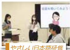
やさしい日本語研修