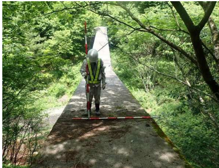
鎌谷川堰堤(三豊市)