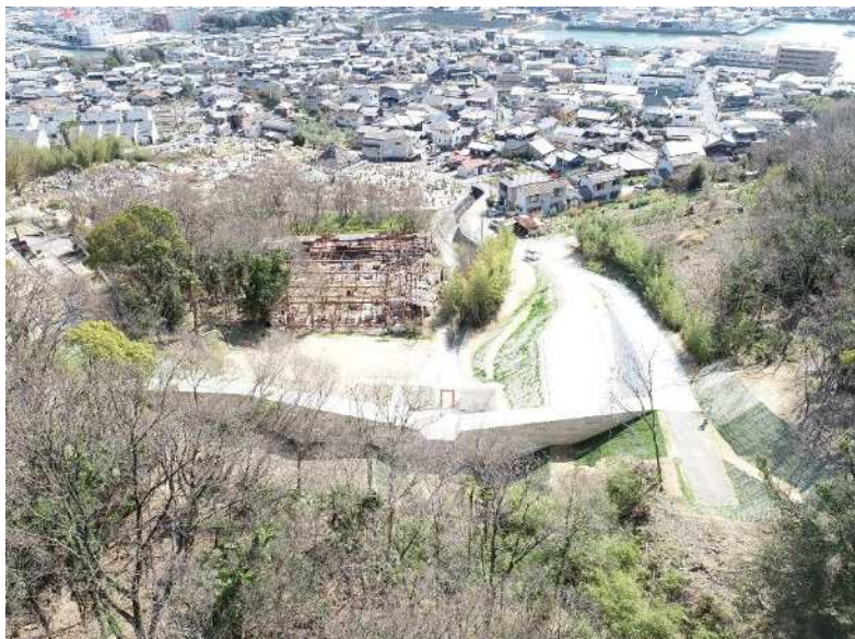
大開西川(小豆郡土庄町)