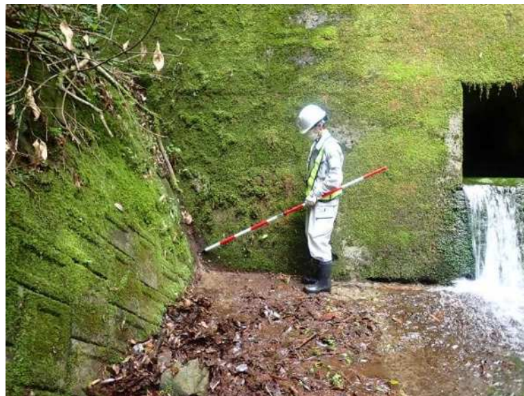
海老済川堰堤(観音寺市)