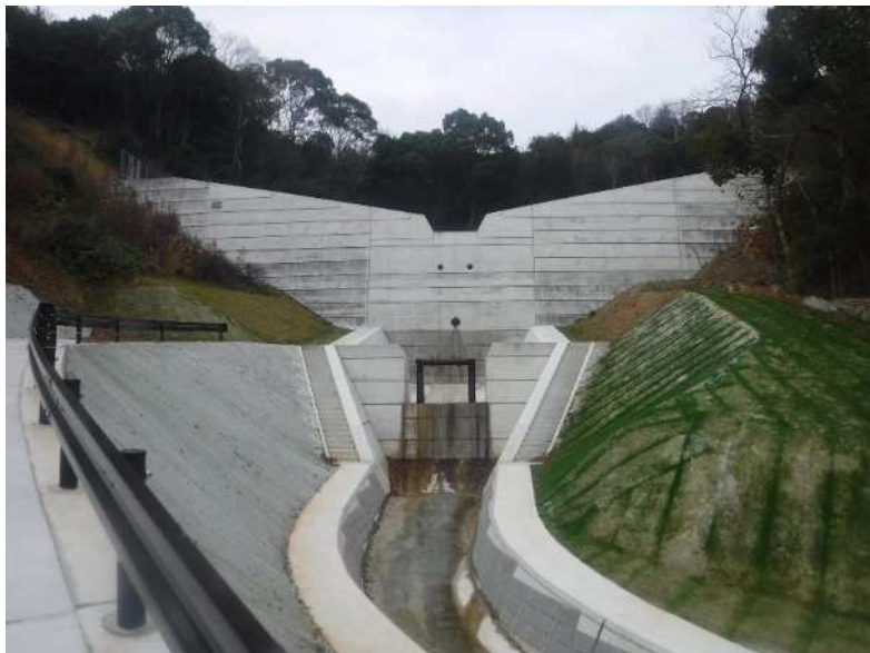
田口川(東かがわ市)