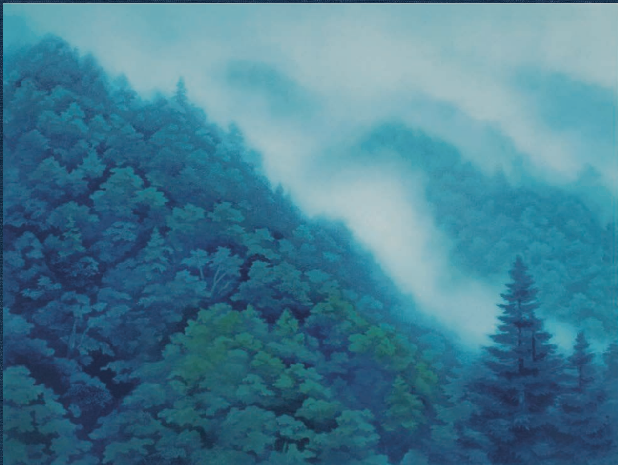
東山魁夷「夏山白雲」リトグラフ

Kagawa Prefectural Higashiyama Kai Setouchi Art Museum