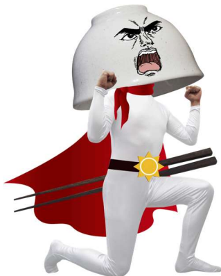
「カイケツ朝ごはん」