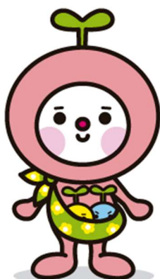
あいさつで笑顔と 元気の種をまくキャラクター おはっぴー

② 「さぬきっ子あいさつ運動」啓発キャラクター「おはっぴー1号」「おはっぴー2号」「はろっぴー」については、下記をご参照ください。