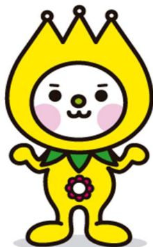
あいさつで 心の花を咲かせるキャラクター はろっぴー