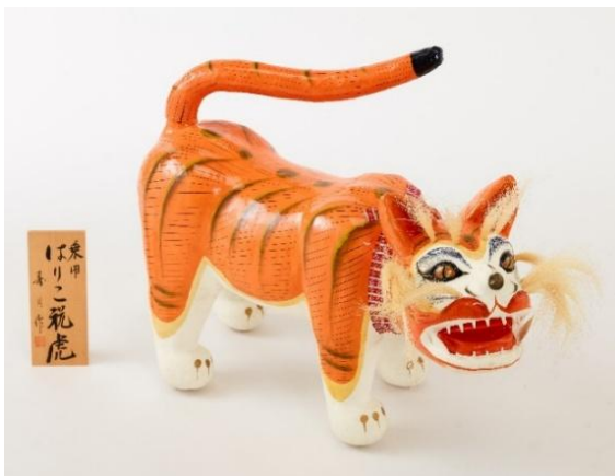
乗用はりこ祝虎 (昭和60年代 個人蔵)