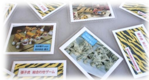
張子虎 絵合わせゲーム (当館制作)

スタッフが撮影などのお手伝いをします！ 写真は、お子様が大きく成長するまで大切に 保管・保存しておいてくださいね。