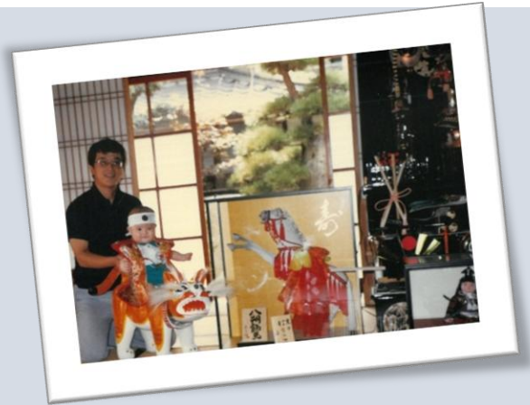
八朔祝いの様子（昭和60年撮影 個人蔵） 協力：田井民芸

西讃地域（香川県西部）を中心に、端午の節供（5月5日）や八朔（旧暦8月1日）に男の子の健やかな成長を祈る縁起物として張子虎などを飾る風習があります。明治時代創業の田井民芸（三豊市三野町）などは、子どもが乗れるほど大きな張子虎を製作しています。かつて床の間などで飾られ、初節供や誕生祝いの定番品であった張子虎。現代の住居ではなかなか飾ることのできない大きな張子虎にお子様を乗せて、「強く、たくましく」育つようお願いを込めて写真を撮ってみませんか？他にも張子虎の絵合わせゲームなど楽しい企画あり！！