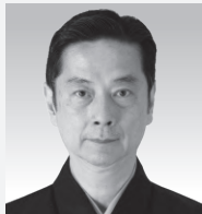
大倉 源次郎(人間国宝)