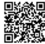
動画ライブラリー