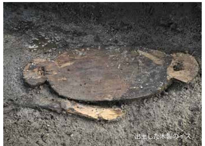
出土した木製のイス

地形の変化をわかりやすく表現した「赤色立体図」から、遺跡を探してみよう！新たな遺跡が見つかるかも？！