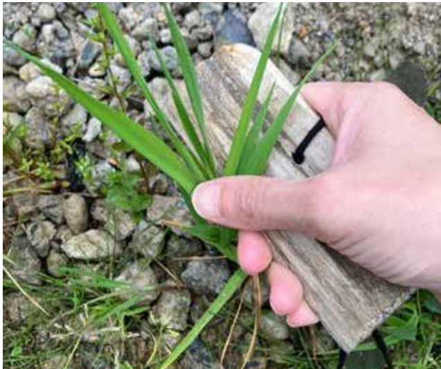
弥生時代の稲刈りの道具を使ってみよう