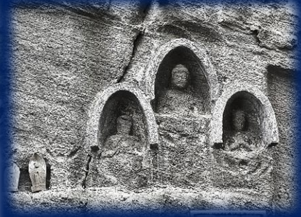
写真：左から仁王門、本堂、彌陀三尊磨崖仏