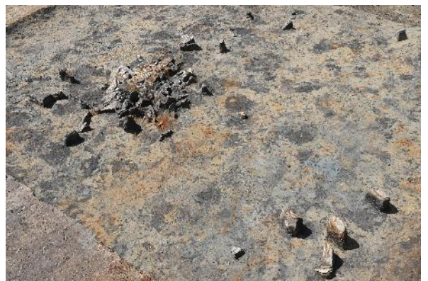
上：弥生時代の流路跡と竪穴建物