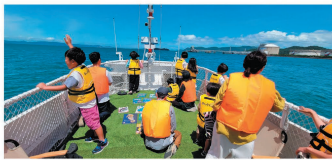
▲瀬戸内海の魅力を伝える「こども図書館船 ほんのもり号」