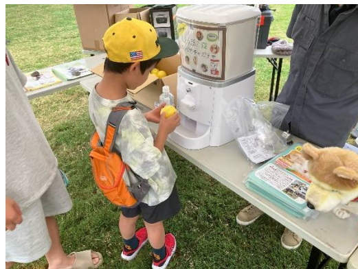
おでかけ！しっぽの森