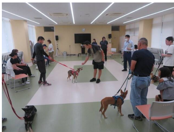
犬のしつけ方教室