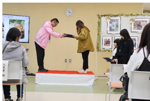
しっぽの森卒業犬猫フォトコンテスト2025