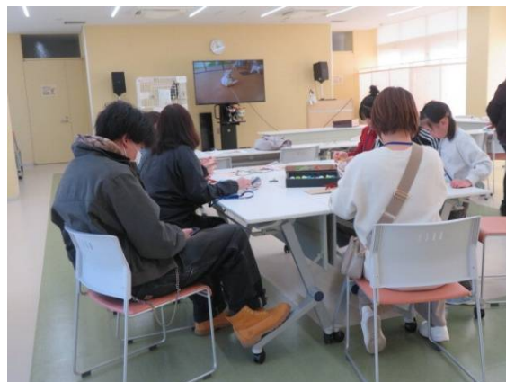
猫との暮らし方教室