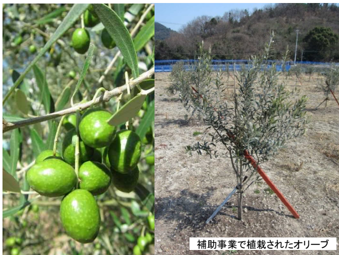
補助事業で植栽されたオリーブ

オリーブの生産に取り組む3法人、2団体、6認定農業者の計11経営体に対し、苗木代の助成や未収益期間の支援を行い、約4haの面積拡大を図ることができました。