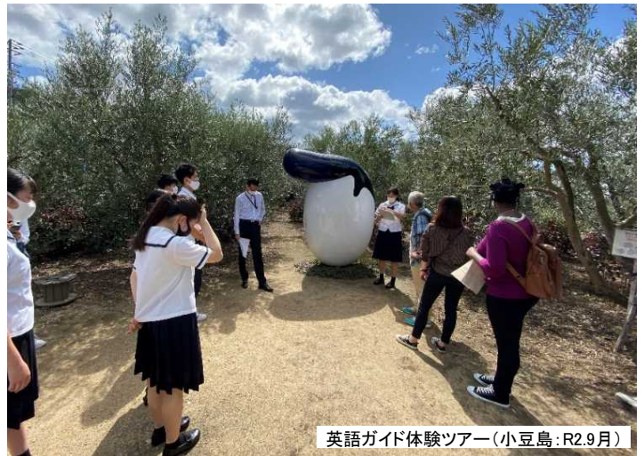
英語ガイド体験ツアー(小豆島:R2.9月)

第5回を迎える「瀬戸内国際芸術祭2022」は、これまでの芸術祭に引き続き、「海の復権」をテーマとし、瀬戸内の12の島々と2つの港周辺を舞台に、春、夏、秋の3会期、計105日間での開催を予定していますので、引き続き、応援をお願いします。