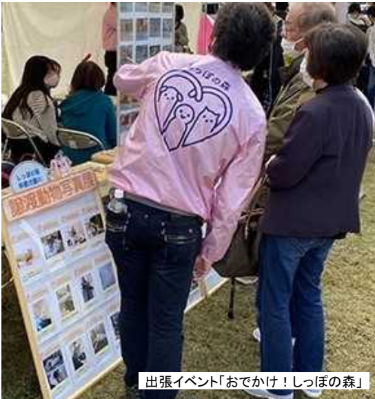
出張イベント「おでかけ！しっぽの森」

これも、皆さまをはじめ多くの方に関心と理解をもっていただいたことや、譲渡ボランティアの方々の御協力があった結果だと思えます。引き続き、応援をお願いいたします。