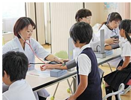
「かがわ糖尿病予防ナビ」より

糖尿病をはじめとする生活習慣病を予防するには、子どもの頃からの適切な生活習慣を身につけることが大切です。