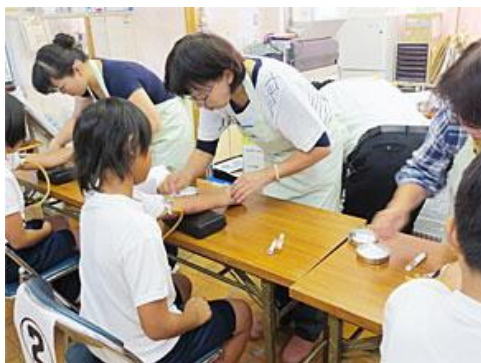
「かがわ糖尿病予防ナビ」より

健診を受けることで、子どもたち自身も自分の健康について知る良い機会になっています。