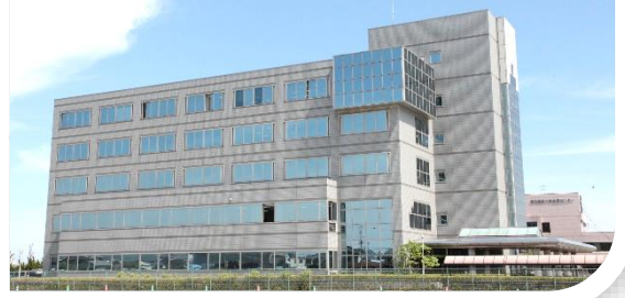
教育センター外観