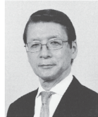
最高裁判所判事 はやし けい いち 林景一 昭和二十六年一月八日生

裁判官としての心構え 約四〇年間、弁護士としての活動から培った経験や市民感覚を踏まえ、弁護士出身の裁判官であることに自覚と誇りを持って、正統と公平に邁り、かつ、健全な社会意識の自覚と誇りを持って、適用に努めていきたいと思っております。 最高裁判所に就任して約一年三か月経過しました。最終審としての判断の重さを更に自覚し、一つ一つの事件に謙虚に向き合い、よりよい判断・解決のため誠実に職務を果たしていく覚悟です。