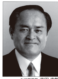
社民党党首 吉田 忠智

衆議院小選挙区選出議員選挙 衆議院比例代表選出議員選挙 最高裁判所裁判官国民審査