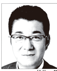
代表 松井 一郎