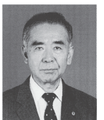
最高裁判所判事 菅野博之 昭和二十七年七月三日生

裁判官としての心構え 裁判官としての心構え 社会情勢が大きく変動し、価値観が多様化するに連れて、利害の対立、争奪等が増えています。様々な対立が生み出す紛争等について、証拠に基づき客観的に事実を認定し、法的に正しく判断することによって、検証可能な形で判断を下す役割は、より重要なものになっていると思います。常に中立・公平であることを心に刻み、社会事をできるだけ幅広く考え、多様な考え方の違いを受容し、正義にかなう適切な判断を下すことを目指して力を尽くしたいと考えています。