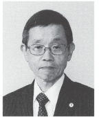
最高裁判所判事 山口 厚 昭和二十八年二月六日生

裁判官としての心構え 裁判官としての心構え 社会情勢が大きく変動し、価値観が多様化するに連れて、利害の対立、争奪等が増えています。様々な対立が生み出す紛争等について、証拠に基づき客観的に事実を認定し、法的に正しく判断することによって、検証可能な形で判断を下す役割は、より重要なものになっていると思います。常に中立・公平であることを心に刻み、社会事をできるだけ幅広く考え、多様な考え方の違いを受容し、正義にかなう適切な判断を下すことを目指して力を尽くしたいと考えています。