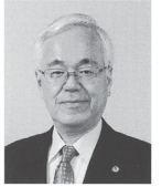
最高裁判所判事 戸倉三郎 昭和二十九年八月二日生

裁判官としての心構え 社会情勢が大きく変動し、価値観が多様化するに連れて、利害の対立、争奪等が増えています。様々な対立が生み出す紛争等について、証拠に基づき客観的に事実を認定し、法的に正しく判断することによって、検証可能な形で判断を下す役割は、より重要なものになっていると思います。常に中立・公平であることを心に刻み、社会事をできるだけ幅広く考え、多様な考え方の違いを受容し、正義にかなう適切な判断を下すことを目指して力を尽くしたいと考えています。