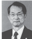
最高裁判所判事 おお たち なお と 大谷直人 昭和二十七年六月三日生

略歴 北海道赤平市で生まれ、道内（札幌市、三上市）で過ごし、その後、東京に転居し、都立富士高等学校、東京大学法学部を卒業 昭和五二年 四月 判事補任官 東京地裁、最高裁判所事務局、裁判所書記官研修所、富山地裁、最高裁判所事務局 六二年 四月 判事任官 最高裁判所調査官、司法研修所教官 六三年 四月 判事任官 最高裁判所第一課長、東京地裁判事、東京地裁判事、事務部長、最高秘書課長兼広報課長、刑事局長、人事局長 平成三年 一月 最高裁判所長官 四年 三月 最高裁判所事務総長 六年 七月 大阪府知事 七年 二月 最高裁判所判事