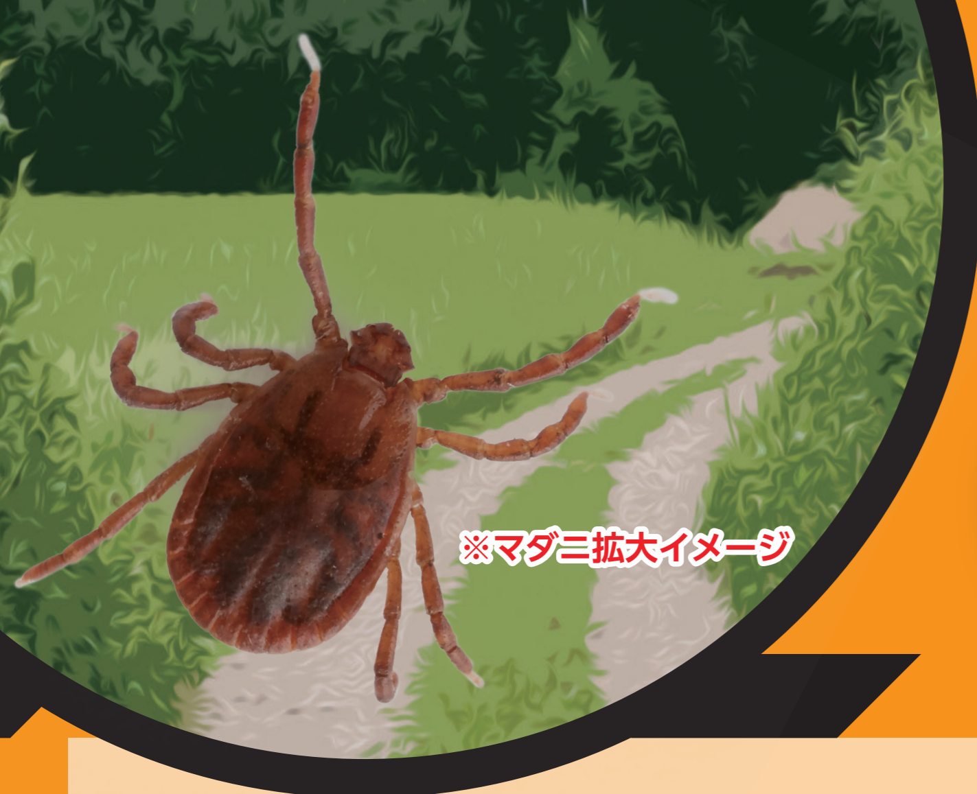
※マダニ拡大イメージ