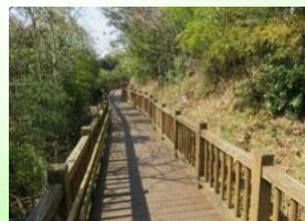
森につながる遊歩道