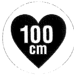
図2 据置きタイプRFID機器 (高出力型950MHz帯パッシブタグシステム) 用ステッカ

注1： ここでは、公共施設や商業区域などの一般環境下で使用されるRFID機器を対象としており、工場内など一般人が入ることができない管理区域でのみ使用されるRFID機器（管理区域専用RFID機器）については対象外としている。なお、管理区域専用RFID機器については、（一社）日本自動認識システム協会において、一般環境への流出を防止するため、取扱説明書等に注意書きを記載するとともに、管理区域専用RFID機器用ステッカ（図3）を貼付することとされている。