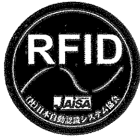
(A) ゲートタイプRFID機器用