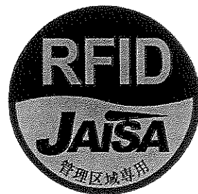
図3 管理区域専用RFID機器用ステッカ

注1： ここでは、公共施設や商業区域などの一般環境下で使用されるRFID機器を対象としており、工場内など一般人が入ることができない管理区域でのみ使用されるRFID機器（管理区域専用RFID機器）については対象外としている。なお、管理区域専用RFID機器については、（一社）日本自動認識システム協会において、一般環境への流出を防止するため、取扱説明書等に注意書きを記載するとともに、管理区域専用RFID機器用ステッカ（図3）を貼付することとされている。