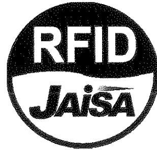
(B) その他のタイプのRFID機器用