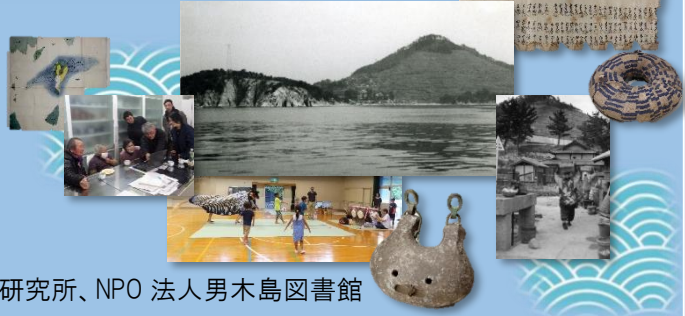
* 注記のない写真は当館蔵